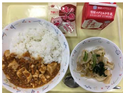
もやしのあますあえ